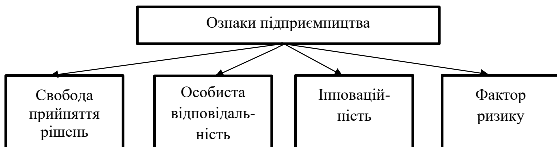
Рис. 1. Ознаки підприємництва

Відомі вітчизняні науковці, такі як Мочерний С., Варналій З., Виноградська А., Сизоненко В. на основі узагальнень наукових поглядів виділили специфічні риси (ознаки) підприємництва, які показані на рис. 1 [5, с. 244; 6, с. 178].