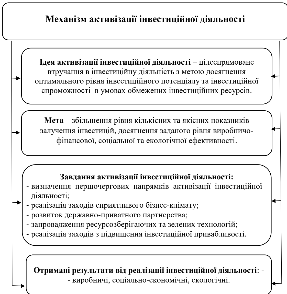
Рис. 1. Механізм активізації інвестиційної діяльності

З метою удосконалення заходів інвестиційної політики нами розроблено механізм активізації інвестиційної діяльності (рис. 1).