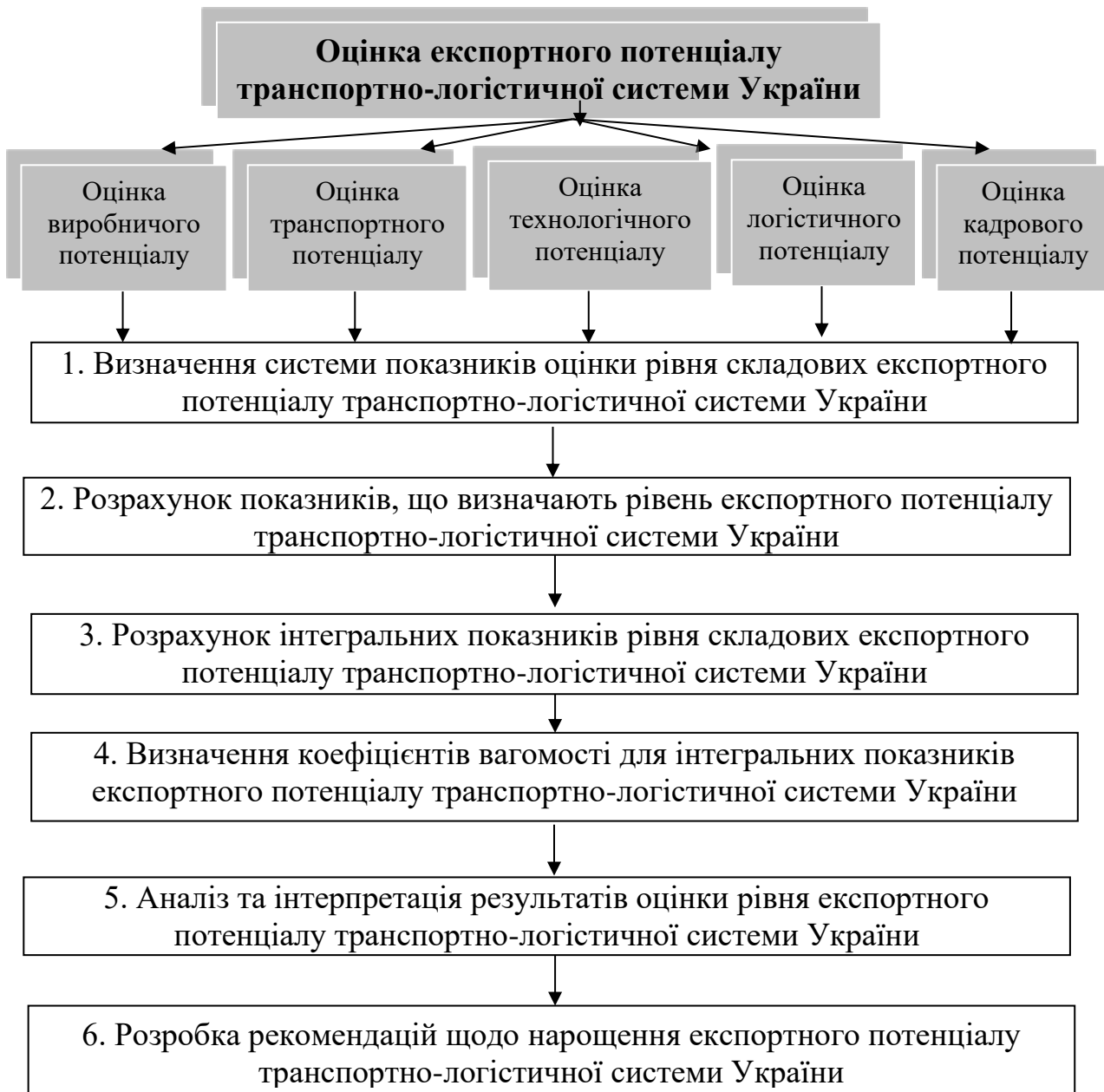
Рис. 1. Етапи оцінки експортного потенціалу транспортно-логістичної системи України

показники оцінки треба звести до загального – інтегрального показника. При оцінці значення експортного потенціалу потрібно брати до уваги ряд показників, які системно відображатимуть рівень експортного потенціалу транспортно-логістичної системи України та враховуватимуть усі чинники, які здійснюють на нього вплив.